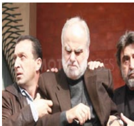
ο δήθεν σοβαρά χτυπημένος πρόεδρος...

διαδηλωτών καθώς και η εισβολή χωρίς το νομικό άλλοθι της εισαγγελικής παρουσίας σε στέκια (όπως στον αυτοδιαχειριζόμενο κοινωνικό χώρο στα Γιάννενα, όπου σε κλίμα τρομοκρατίας μπάτσοι εισβάλλουν βρίζοντας, χτυπώντας και τραμπουκίζοντας συντρόφους και γείτονες).